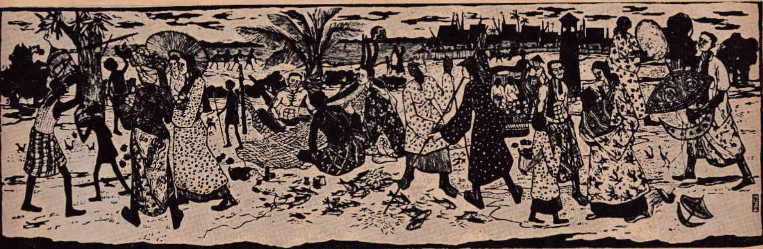
penghidupan di terengganu — gurisan — lai loong seng